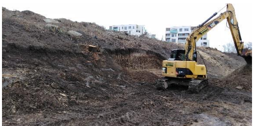
Celkem bylo třeba vytěžit 410 tun zeminy.