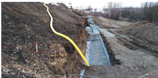
Na vytvoření zpevňujících zdí bylo použito 300 tun kamene.