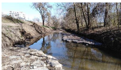
Vznikla řada niv a meandrů, které tok Rokytky zpomalily.