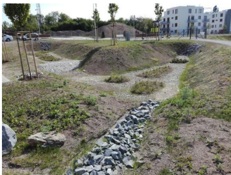
Jeden z řady polderů v rezidenčním areálu Koivu Zličín

Při revitalizaci Rokytky v rámci nové městské čtvrti Suomi Hloubětín využívá YIT zkušeností, které získala především ve svém již dokončeném rezidenčním areálu Koivu Zličín v Praze 5. Ten je vůbec prvním komplexním systémem odvodu dešťových vod pomocí tzv. měkké infrastruktury v rezidenčním projektu v Česku. „Měkká infrastruktura“ je důmyslný systém akumulací, vsaků, retencí a odpařovacích ploch, který efektivně využívá srážkovou vodu a zabraňuje, aby bez užitku stékala do kanalizace. Projekt změny způsobu nakládání s dešťovými vodami trval v Koivu Zličín téměř dva roky a probíhal současně s výstavbou 11 nízkoenergetických bytových domů. Zadržovaná voda slouží mj. k zavlažování celého areálu o ploše téměř 30 000 m 2 a tím k podpoře růstu místní vegetace.