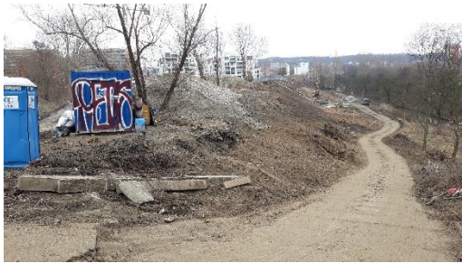
Stabilizace svahů, vytváření nových komunikací.