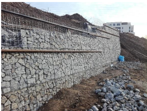
Dokončování zpevňujících zdí.