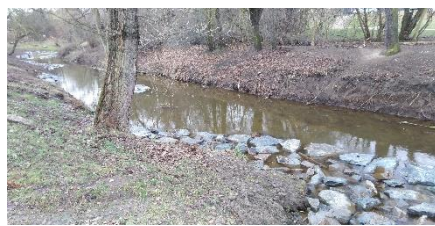
Uložením lomového kamene se naopak na některých místech říčka zrychlila.