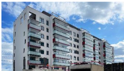
Projekt Lappi Hloubětín ve výstavbě, etapa Ranua

Historicky první koupelnu nainstalovala YIT na podzim roku 2019 ve vzorovém bytě v osmé etapě Pori rezidenčního komplexu Suomi Hloubětín. Ve větší míře pokračovala v etapách sousedního projektu Lappi Hloubětín Kemi