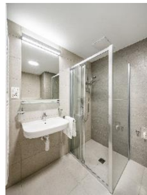
První modulární koupelna v projektu YIT (vzorový byt, etapa Pori v Suomí Hloubětín)

jsme proto k dalšímu rozšíření a kromě koupelen instalujeme do projektu Happi Milánská i další konstrukční prvky z prefabrikátů – schodišťová ramena, výtahové šachty, balkonové desky, stropní filigrány a nově též stěnové panely. Modulární výstavba nepřináší jen úsporu času a pracovní síly, ale také zefektivnění a zkvalitnění výroby. Zákazník se vůbec nemusí bát bytových jader v duchu staré panelákové zástavby. Tyto modulární koupelny jsou vyráběny moderní technologií z vysoce kvalitních materiálů a člověk je na pohled nijak nerozezná od současné klasické výstavby. Naopak díky příjemnějšímu a bezpečnějšímu pracovnímu prostředí pro dělníky získá ještě lépe postavený byt, jelikož se snižuje třeba riziko křivě položené a špatně vyspáované dlažby.“