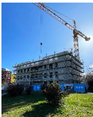
Projekt Happi Milánská ve výstavbě

Výstavba z modulů, tzv. prefabrikace, má oproti té tradiční svá specifika. Její princip spočívá v tom, že na staveništi se přivážejí hotové moduly (např. celá budoucí koupelna bytu včetně zařizovacích předmětů, obkladů a dlažeb), které předtím vznikly ve specializovaných výrobních závodech. Na