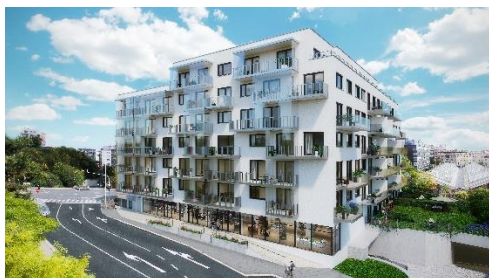
Projekt Koru Vinohradská

Na realitním trhu v Praze je po nových bytech obrovská poptávka, proto není výjimkou, že bývají vyprodány již během prvních fází výstavby vznikajících projektů. Zákazníci si tak často