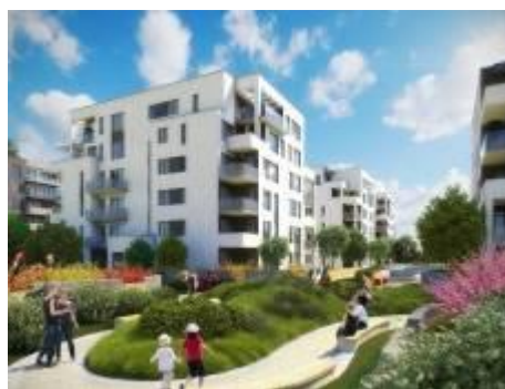
Vizualizace etapy Turku projektu Suomi Hloubětín

V rámci etapy Turku vyrostly v areálu původního brownfieldu v pražském Hloubětíně čtyři nízkoenergetické domy v elegantním, středním stylu inspirovaném klasickou severskou architekturou dle návrhu ateliéru Loxia Architectes Ingenierie. K 106 bytům v dispozicích 1+kk po 5+kk a o velikostech 32 m 2 až 142 m 2 náleží polozapuštěné balkony, prostorné terasy či klidné předzahrádky plné zeleně. Bloku budov pak dominuje organický tvar společného zeleného patia s herními prvky a místy k odpočinku a relaxaci, který při pohledu z oken připomíná různorodost finské krajiny tvořené jezery a lesy.